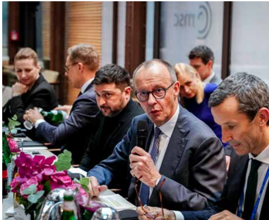
Bild oben: Mette Frederiksen, Ministerpräsidentin von Dänemark, Alexander Stubb, Präsident von Finnland, Wolodymyr Selenskyj, Präsident der Ukraine, Bundeskanzler Friedrich Merz (CDU) und Günter Sautter, außen- und sicherheitspolitischer Berater des Bundeskanzlers, nehmen bei der 62. Münchner Sicherheitskonferenz (MSC) an einem Treffen im Berliner Format teil.

Auch das Polizeipräsidium Oberbayern Nord, das für den Flughafen München zuständig ist, zog angesichts der An- und Abreise zahlreicher hochrangiger Gäste eine positive Einsatzbilanz. Herrmann dankte den einsatzführenden Polizeipräsidien München und Oberbayern Nord sowie allen Einsatzkräften aus Bayern, anderen Bundesländern, dem Bund und dem Ausland für ihren besonnenen und hochprofessionellen Einsatz.